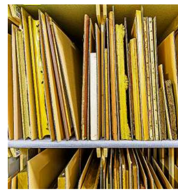
Gemäldelager.